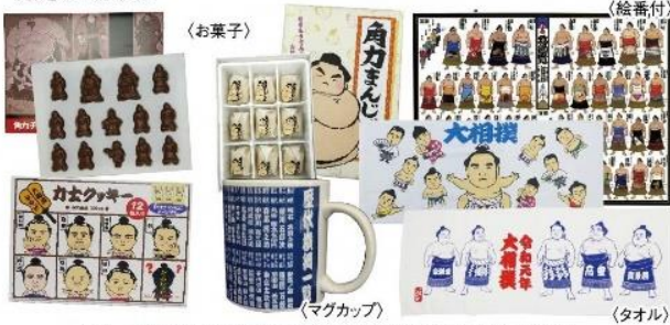
イメージ画像(実際のお品とは異なる場合がございます)

※上記セットは予約販売のみとなります。 ※お弁当・お土産セットのみでの入場はできません。 (別途座席券をお買い求めください。) ※外部からの飲食物のお持ち込みはできません。 ※当日10:00～13:30までに会場内の引換所にて お引き換えください。